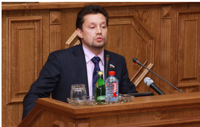
Виктор Звагельский.

На этот раз Виктор Звагельский предлагает приравнять к фальшивомонетчикам тех, кто занимается подделкой акцизных марок, а также уголовно преследовать продуктовые сети, продающие спиртное с ними. Аналитики думают, что в случае принятия этих проектов страх будет наведен лишь на торговые сети, а не на производителей фальшивого алкоголя и акцизных марок.